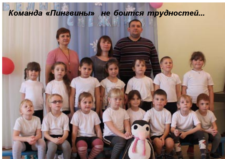
Команда «Пингвины» не боится трудностей...