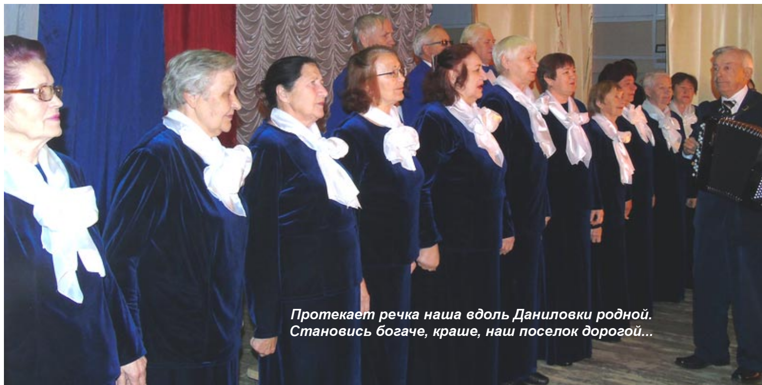
Протекает речка наша вдоль Даниловки родной. Становись богаче, краше, наш поселок дорогой...

хора "Криницы" проходили в музыкальной школе, а позже для этих целей было выделено помещение в РДК. И если вначале члены хора не умели петь даже на два голоса, то их желание и старание плюс талант руководителя дали желаемый результат. Теперь многие песни в репертуаре хора исполняются и на четыре, и на пять голосов, где ярко и слаженно звучат сопрано, альты, теноры и баритоны. Любое произведение композитор расписывает под свой коллектив, образно представляя, каким будет звучание, и уже за одну репетицию прорисовывается хороший "черновик" его исполнения.