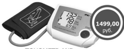
ТОНОМЕТР AND автомат UA-777 с адапт. Измерение давления