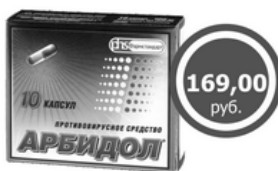
АРБИДОЛ капс. 100мгх10 От простуды и гриппа