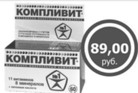
КОМПЛИВИТ табл. х60 Поливитамины