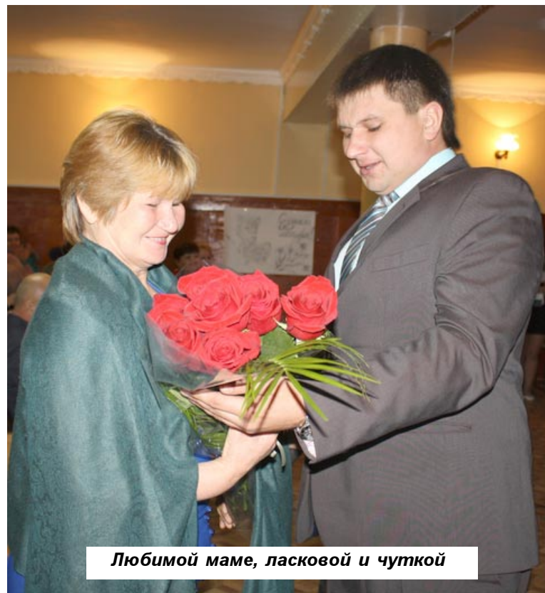
Любимой маме, ласковой и чуткой