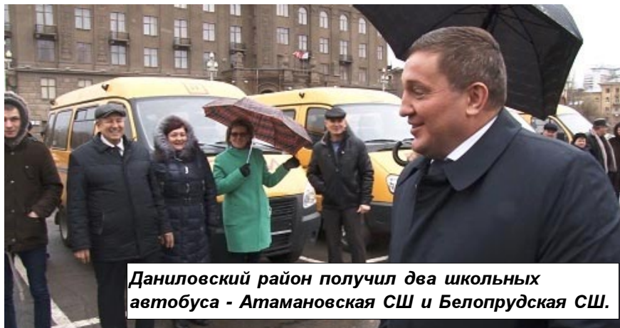
Даниловский район получил два школьных автобуса - Атамановская СШ и Белопрудская СШ.

Новые машины, среди которых 49 "Газелей", 15 автомобилей марки "Ford", 15 автобусов марки "ПАЗ" и 6 автобусов "ВОЛГАБАС", распределены в школы 36 муниципальных районов и городских округов. В общей сложности они будут перевозить свыше