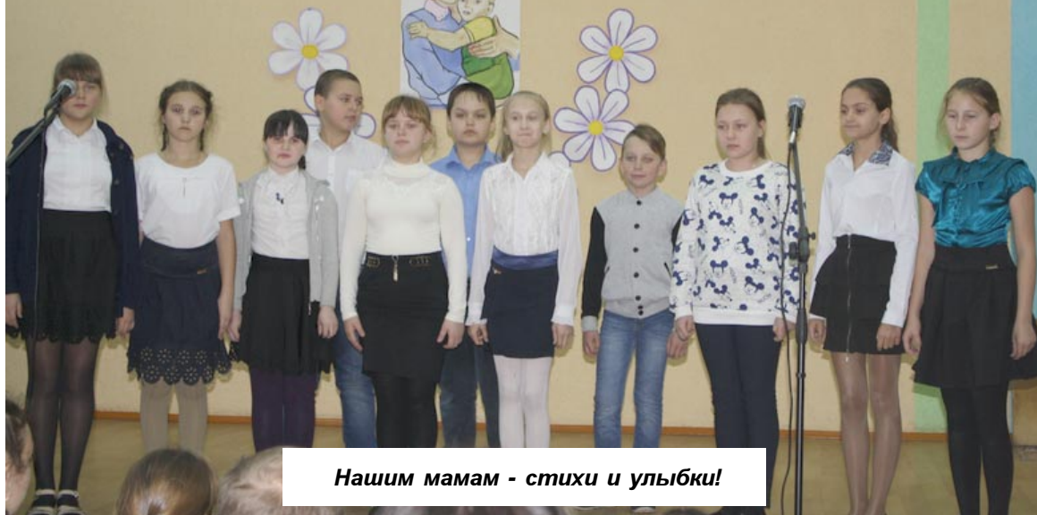
Нашим мамам - стихи и улыбки!

День матери - один из тех праздников, который невозможно пропустить в суете повседневных забот. И посвящен он самой любимой и самой главной женщине, подарившей возможность жить и радоваться жизни.