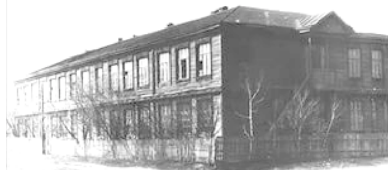
Деревянное здание Сергиевской школы. 50-е годы XX века.

ми рассмотрели проекты планов депутаты от Орловской станицы и остались по-прежнему неудовлетворенными в части отводимой им территорией. Они посчитали ее недостаточной для ведения хозяйства. Станица насчитывала уже 747 душ населения, 4 священнослужителя, а ее жители имели в своих хозяйствах поголовье из 1511 лошадей, 1420 голов рогатого скота и 6330 овец. В свою очередь с подобными заявлениями выступили и заполянские депутаты. В станице насчитывалось 848 душ населения, в хозяйствах которых хотя было и меньше поголовья, однако и удобной земли явно недоставало из-за того, что в отводимом участке земли много было песчаного и солонцового пространства. Это стало предметом для крупных ссор между станичными обществами и их депутатами. Войсковое правление, дабы привести жителей двух станиц к согласию, приняло решение упразднить оба станичных управления и образовать новое административно-территориальное объединение, назвать его Сергиевской станицей и поселить на новом месте, поэтому значительная часть Орловской и Заполянской станиц переселилась на новое место, занимаемое в настоящее время. А поселения, оставшиеся на старом месте, были названы хуторами