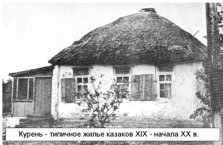
Курень - типичное жилье казаков XIX - начала XX в.

ми рассмотрели проекты планов депутаты от Орловской станицы и остались по-прежнему неудовлетворенными в части отводимой им территорией. Они посчитали ее недостаточной для ведения хозяйства. Станица насчитывала уже 747 душ населения, 4 священнослужителя, а ее жители имели в своих хозяйствах поголовье из 1511 лошадей, 1420 голов рогатого скота и 6330 овец. В свою очередь с подобными заявлениями выступили и заполянские депутаты. В станице насчитывалось 848 душ населения, в хозяйствах которых хотя было и меньше поголовья, однако и удобной земли явно недоставало из-за того, что в отводимом участке земли много было песчаного и солонцового пространства. Это стало предметом для крупных ссор между станичными обществами и их депутатами. Войсковое правление, дабы привести жителей двух станиц к согласию, приняло решение упразднить оба станичных управления и образовать новое административно-территориальное объединение, назвать его Сергиевской станицей и поселить на новом месте, поэтому значительная часть Орловской и Заполянской станиц переселилась на новое место, занимаемое в настоящее время. А поселения, оставшиеся на старом месте, были названы хуторами