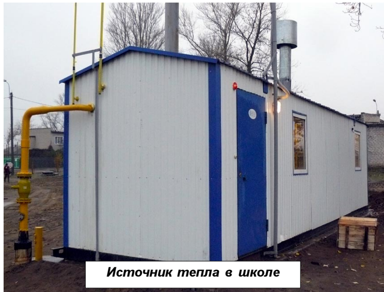
Источник тепла в школе

ков, которые в последующих номерах "ДВ" будут опубликованы.